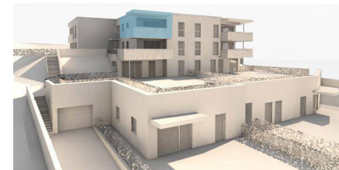
lage im gebäude